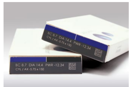
Verpackungskennzeichnung durch Farbabtrag