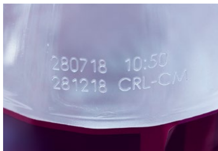
Beschriftung von PET-Flaschen