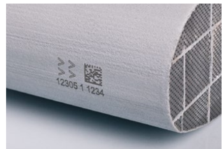
2D Code Markierung auf Rußpartikelfiltern