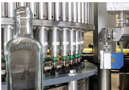
Kennzeichnung von Glas

Das einheitliche Bedienkonzept für alle REA JET Technologien.