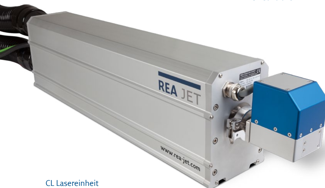
CL Lasereinheit Schutzklasse IP65