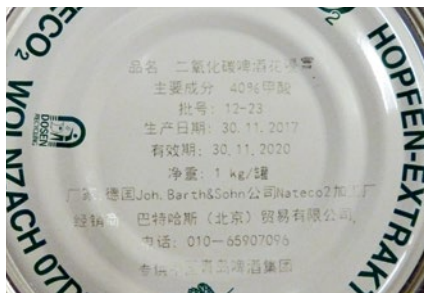
Kennzeichnung von Weißblechdosens